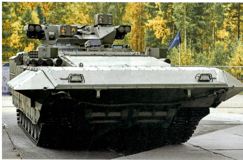
Schwerer Kampf-Schützenpanzer T-15 Armata an der Russian Arms Expo 2015.

Das unter dem Namen Afghanistan bekannt gewordene Aktivschutzsystem detektiert mit einem leistungsfähigen AESA-Radar ( Active Electronically Scanned Array , Radar mit aktiver elektronischer Strahlenschwenkung), das auch beim neuen russischen Mehrzweckkampflugezeug Suchoi T-50 zum Einsatz kommt, anliegende Projektile und bekämpft diese mit Softkill- (Störung der gegnerischen Zielerfassungssysteme mittels künstlichen Nebels und/