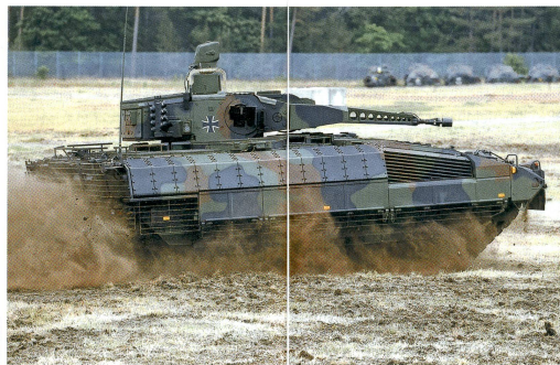
Der Puma, ein Produkt der deutschen Firmen Krauss-Maffei Wegmann und Rheinmetall.