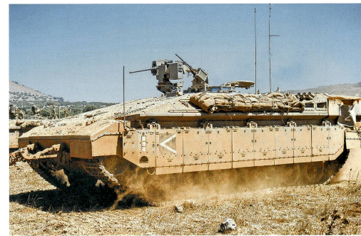
Schwerer Schützenpanzer Namer der IDF (Israel Defense Forces).