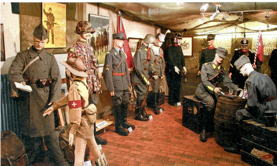
Im Zeughaus Uster: Blick ins Schweizerische Unteroffiziersmuseum.