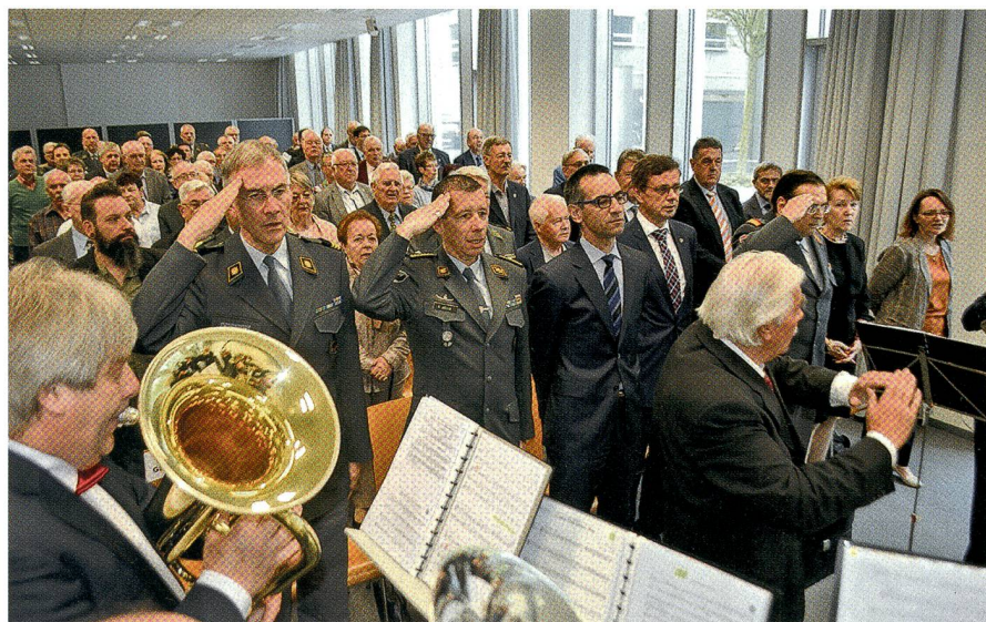
Mit dem gemeinsamen Singen des Schweizerpsalms wird der Festakt in Biel eröffnet.

Gutes berichtete der Chefredaktor Peter Forster. Der SCHWEIZER SOLDAT trete unentwegt, mutig und manchmal auch gegen Widerstand ein für die Unabhängigkeit und Freiheit unseres Vaterlandes, der