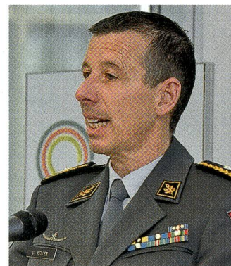
Brigadier Keller überbringt die Glückwünsche der Armee.