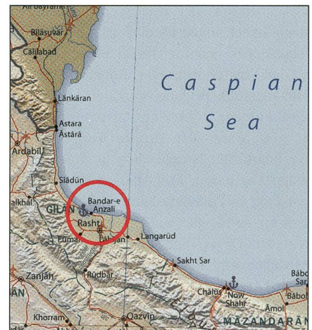
Rot bezeichnet die Hafenstadt Bandar-Anzali, wo die Raketen entdeckt wurden.