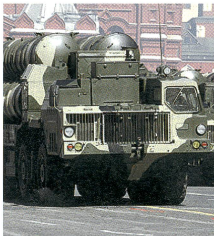
Die S-300 ist ein leistungsfähiges russisches Boden-Luft-Fliegerabwehrsystem.