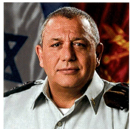
Generalleutnant Gadi Eizenkot. Auf der Schulter das braune Golani-Beret.