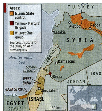
Braun der ISIS in Syrien. Dunkelbraun die Yarmouk-Brigade am Dreiländereck Israel/Jordanien/Syrien. Dunkelgelb bei Gaza der ISIS-Ableger Wilayet Sinai.

Was Israel mehr bedroht, ist die offensichtliche Verbindung des ISIS-Ablers mit der Hamas, die seit dem Bürgerkrieg