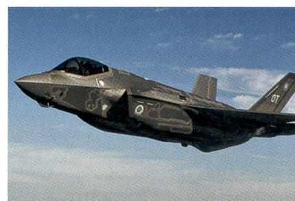
Der F-35I heisst Adir (der Grossartige).