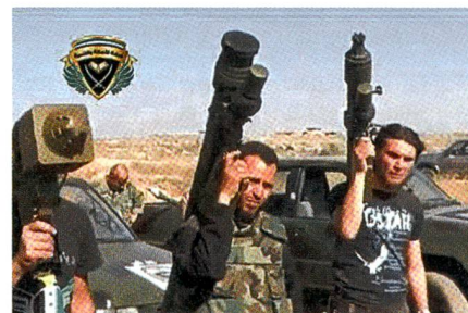
Syrien: Rebellen mit Sa-24.