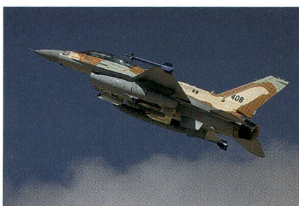
Die Luftwaffe setzt rund 400 F-16I ein.