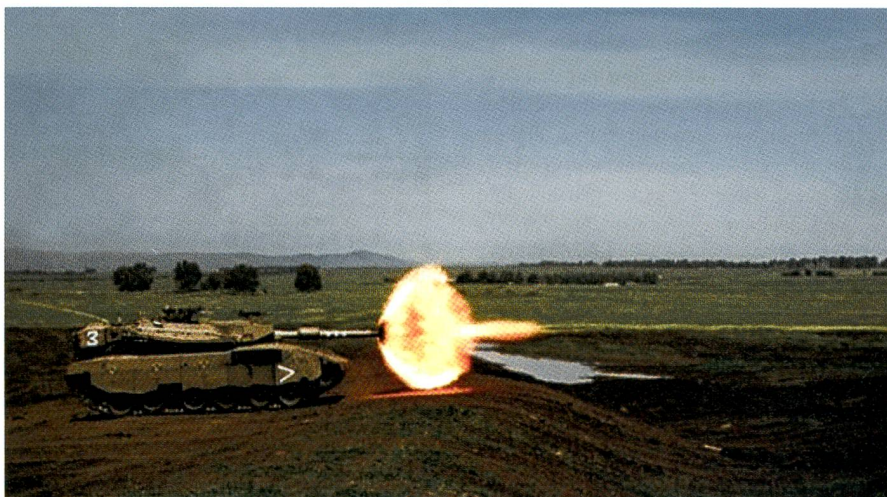
Der redoutable Merkava-IV bildet das Rückgrat der israelischen Panzertruppe.