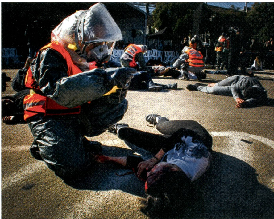
Ein Rettungssanitäter leistet im Hof der Ben-Gurion-Universität Erste Hilfe.