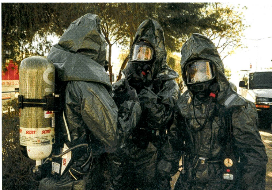
ABC-Kader der Armee bereiten sich auf ihren Einsatz in der verseuchten Zone vor.