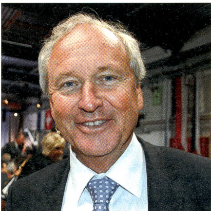
Genie-Offizier Winiker bei der Luftwaffe.

Es gibt bekanntlich Grussworte und Grussworte. Den Luzerner Regierungsrat Paul Winiker zu hören, ist immer eine Freude; denn er spricht Klartext.