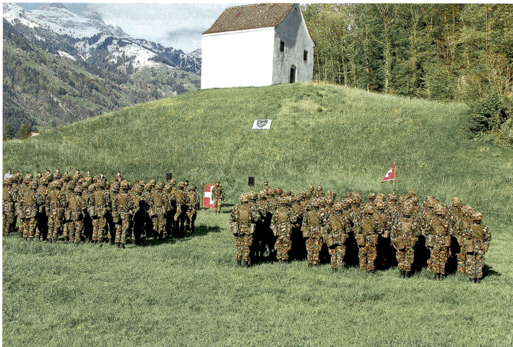
Die Urner Landsgemeindewiese «zu Bötzingen an der Gand bei Schattdorf».