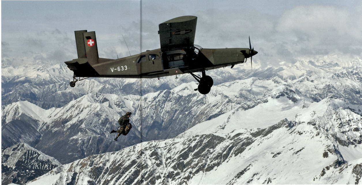
Die Leichtfliegerstaffel (LT St 7) transportiert mit ihren Pilatus Porter PC-6 Fallschirmaufklärer und setzt sie in bis zu 8000 m Höhe ab – im Bild ein Absprung eines «17ers» mit modernster Ausrüstung über den Alpen.

Einsätze bei den amerikanischen «Green Berets» und beim legendären engli-