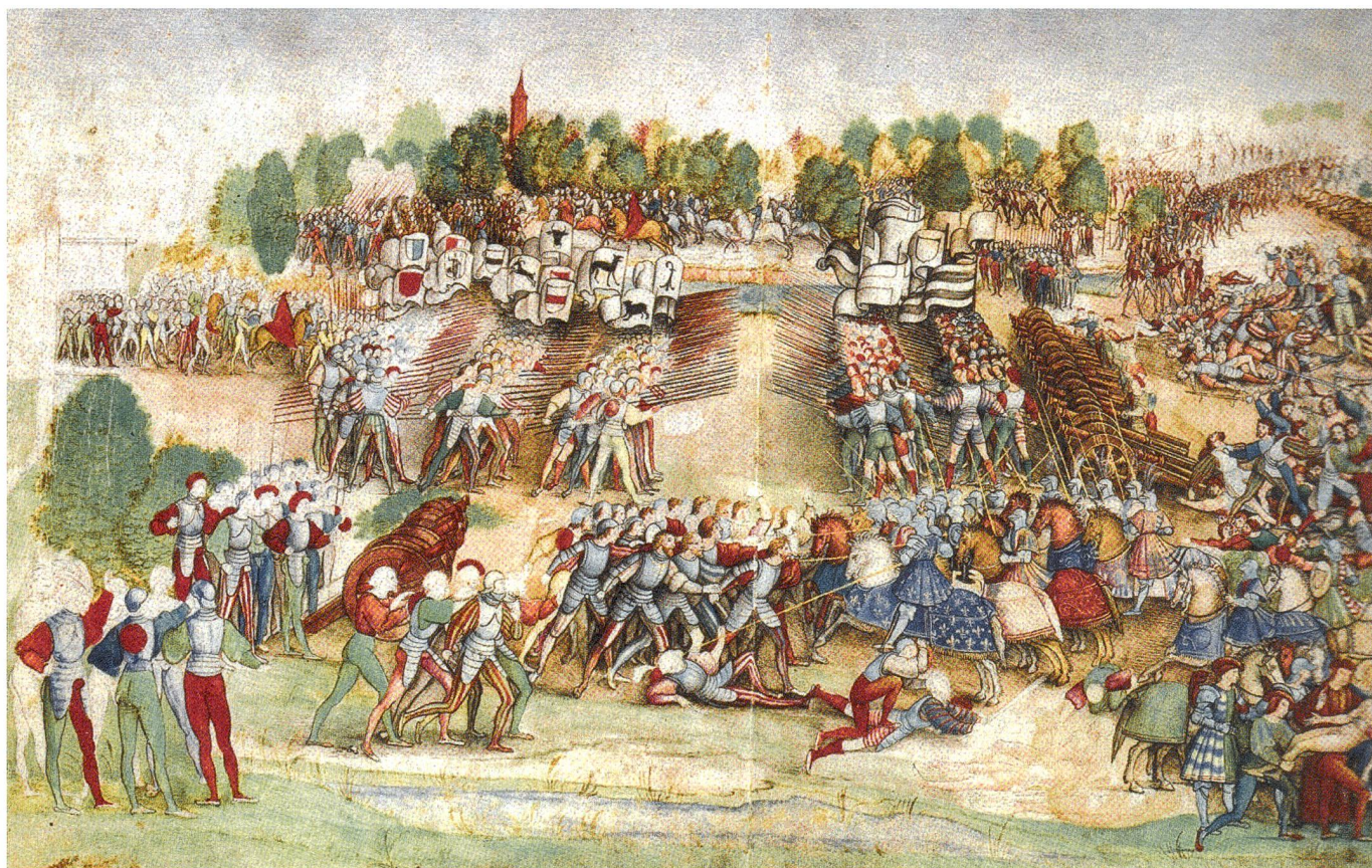
Maître à la Ratière (zugeschrieben): Schlacht von Marignano. Vereinigung verschiedener zeitlich sich folgenden Kampfszenen; Details: Franz I. mit Lilien am blauen Schlachtmantel des Pferdes; französische Artillerie hinter den Landsknechten aufgereiht; Kardinal Schiner im roten Mantel links vor der Schlacht und oben Mitte auf dem Rückzug.

Da die Schlacht nur einen Tag dauerte, kann von einer ordentlichen Versorgung