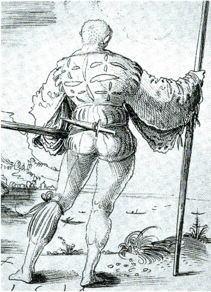
Schweizerdolch