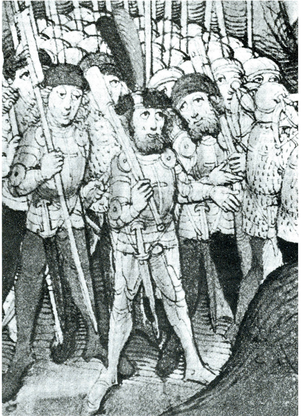
Zwei Büchenschützen und ein Halbartier mit Schweizerdegen.