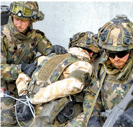
Panzergrenadiere aus dem Pz Bat 17 überwältigen im Nalé einen Terroristen.

tun, der nicht durch grosse konventionelle Kräfte auffällt, sondern vor allem politisch agiert – sichtbar durch Strassenblockaden in Städten und Dörfern und durch laute politische Manifestationen.