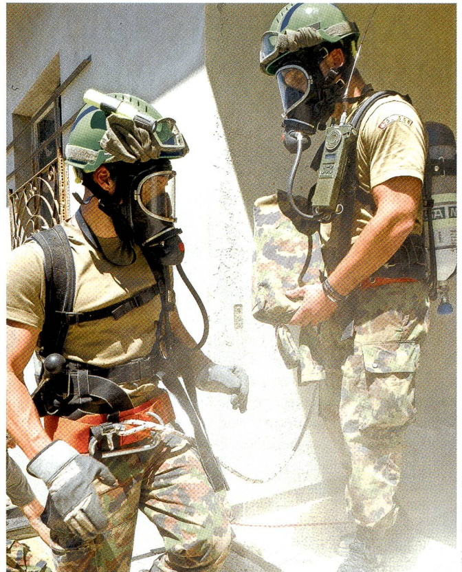
Harte Arbeit bei grosser Hitze. Man beachte den Helmaufsatz!