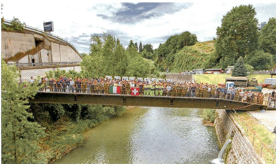
In freundschaftlicher, guter Harmonie: Der italienisch-deutsche Brückenschlag.

Im FU Bat 23 hat die HQ Kompanie 23/1 das HQ in der Zivilschutzausbildungsanlage Rivera bezogen. Die Kompanie stellt mit ihrer Arbeit den Stabsoffizieren der Ter Reg 3 die notwendigen Führungsmittel zur Verfügung, damit die Aufträge termingerecht wahrgenommen werden können.