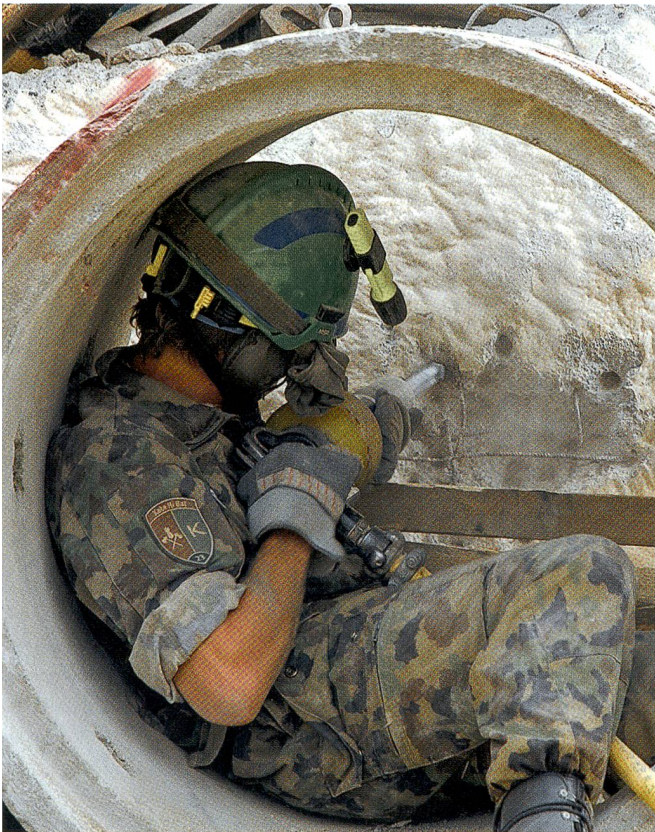
Da sind Spitzenhandwerker und Spitzentruppen gefragt!