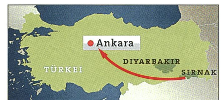
Die geplante C-130-Route für die Putsch-Flüge nach Ankara – elend gescheitert.