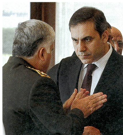
Der MIT-Geheimdienst-Chef Hakan Fidan berät sich mit einem Heeres-General.