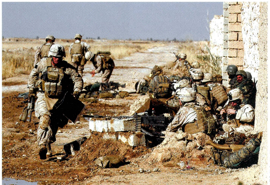
Britische Truppen gehören zu den schlagkräftigsten der NATO, die der Brexit stärkt.

Nach 4 Uhr Ortszeit gab es für die BBC kein Zurück mehr: Am massgebenden Sender rief der 78-jährige Moderator David Dimbleby den Brexit aus, was in London, im Königreich, in Europa und der Welt ein politisches Erdbeben auslöste – Jubel bei den Brexit-Fans, Erstarrung und Wut bei den Euro-Turbos. We have our country