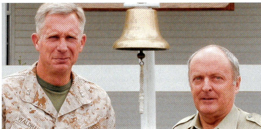
General Tom Waldhauser wird Befehlshaber des African Command. Das Bild zeigt ihn als Kdt der 1. Marinedivision mit dem Autor Kürsener in Camp Pendleton.