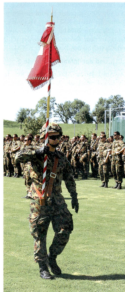
Das Feldzeichen der L Flab Lwf Abt 7.