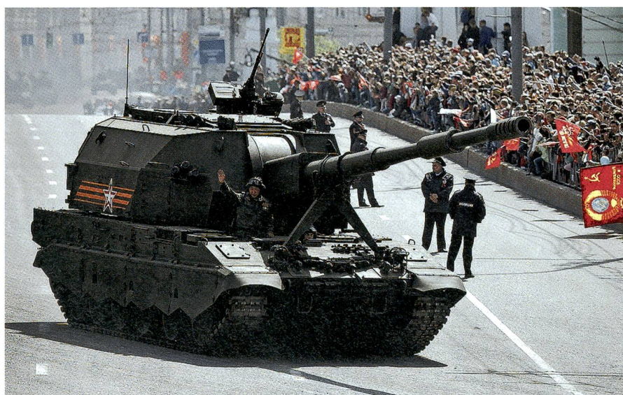
Moderne russische Artillerie: Das 70 Kilometer weit reichende Geschütz Koalizija-SW.