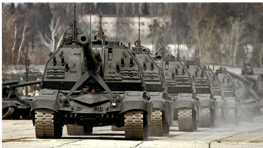
Die Standard-Panzerhaubitze 2S19 Msta-S, mit einer Kadenz von acht Schuss/Minute.