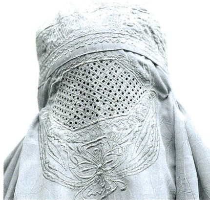
Der Ganzkörperschleier Burka ist noch gefährlicher als der Nikab: Er verdeckt selbst die Augen mit einem Stoffgitter.

kehrt ist jedoch ihr Gegenüber dazu nicht in der Lage. Wo mit zweierlei Ellen gemessen wird, entsteht zu Recht Misstrauen.