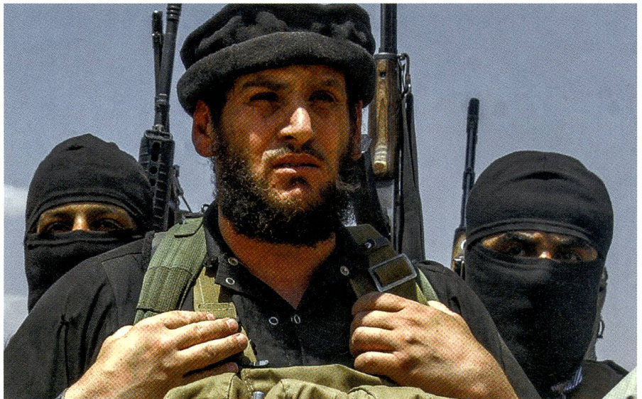
Eines der seltenen Bilder von Abu Muhammad al-Adnani mit zwei Leibwächtern.

Der ISIS selber liess sich ebenfalls am 31. August 2016 verlauten. Die Terroristen-Organisation bestätigte den Tod al-Adnani, den sie zum Märtyrer «beförderte» und