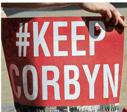
Labour-Demo: «Wir behalten Corbyn».