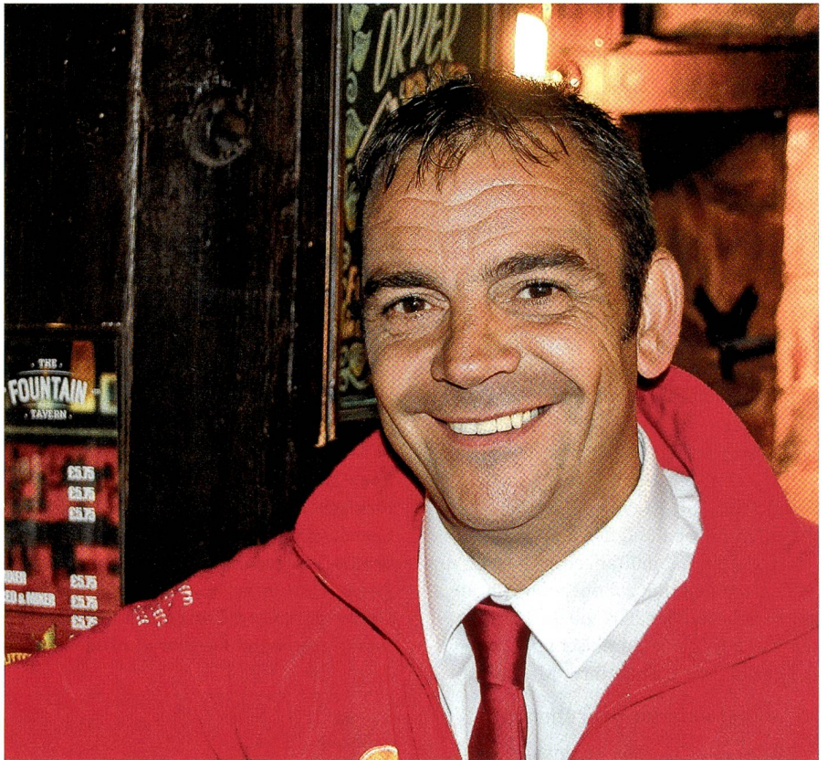
In einem Pub von Belfast. Der Mann diente 16 Jahre in der britischen Rheinarmee.

Wem wir begegnen auf dem zauberhaften Flohmarkt im oberirdischen Metrobahnhof oder an der eleganten Grey Street , alle freuen sich am Brexit. In Newcastle stimmten viele Arbeiter gegen ihre eigene