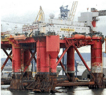
Im Hafen der nordirischen Stadt Belfast.