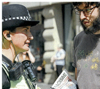
Polizei gegen unbewilligte Kundgebung.