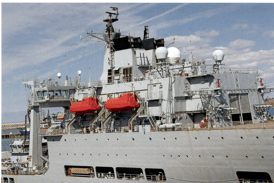
Der britische Tanker A390 Wave Ruler, aufgenommen am 14. August 2016 in Portland.