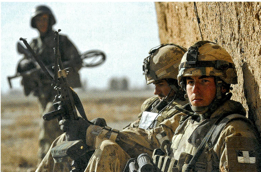
Britische Elitetruppen stehen an vielen Fronten im Kampfeinsatz.