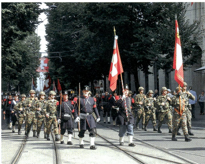
Der KUOV-Fahnenzug und die Compagnie 1861 beim Einmarsch.