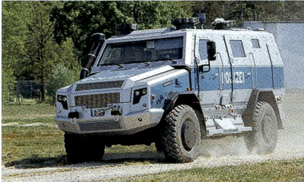
Personentransportfahrzeug Survivor R.

Gemeinsam mit Achleitner präsentierte RMMV ein kostengünstiges geschütztes Personentransportfahrzeug. Basierend auf einem 242 kW starken Lkw-Fahrgestell