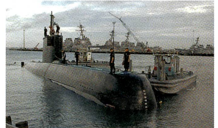
Kampfwertsteigerung der peruanischen U-Boote der Klasse 209/1200.

ThyssenKrupp Marine Systems (TKMS) hat von der peruanischen Marine bzw. der peruanischen Marinewerft SIMA einen Auftrag im Umfang von 40 Millionen Euro für die grundlegende Modernisierung von vier