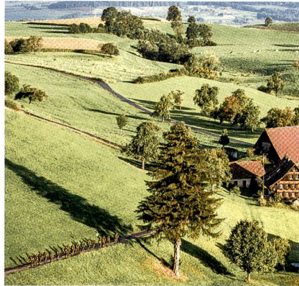
Zwischen dem Gubel und Menzingen.

Das Landschaftsbild auf dem Titelblatt der Doppelausgabe findet Beifall unter unseren Leserinnen und Lesern. Mehrere Fragen: Woher stammt die Aufnahme?