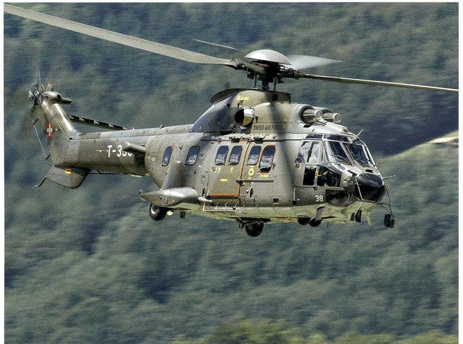
Das Bild unseres Aviatikfotografen Franz Knuchel zeigt den Transporthelikopter Cougar T-338, der am 28. September 2016 beim Start auf dem Gotthard zerschellte.

Beide, Bättig und Löchel, waren fröhliche, zupackende Männer. Als Parteifreunde den Stadtrat Bättig als Stadtpräsidenten ins Spiel bringen wollten, lehnte Bättig dankend ab: Er wolle ein Amt, wo er direkt zupacken könne, keine «politische»