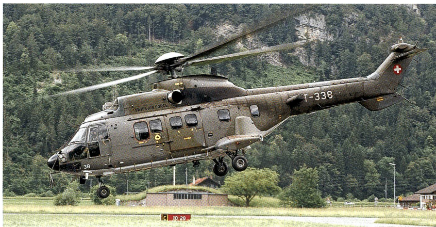
Die Unglücksmaschine, der Cougar T-338. Die Cougar tragen Nummern über T-331. Die Medien meldeten falsch den Absturz eines Superpuma (Nummern nur bis T-325).

in kurzen Worten mit, der Helikopter habe beim Rückflug vom Pass eine Stromleitung gestreift. Ebenso dämpfte Bundesrat Guy Parmelin, auch er oben auf dem Gotthard, die Spekulationen in einem ruhigen, gesetzten Statement.