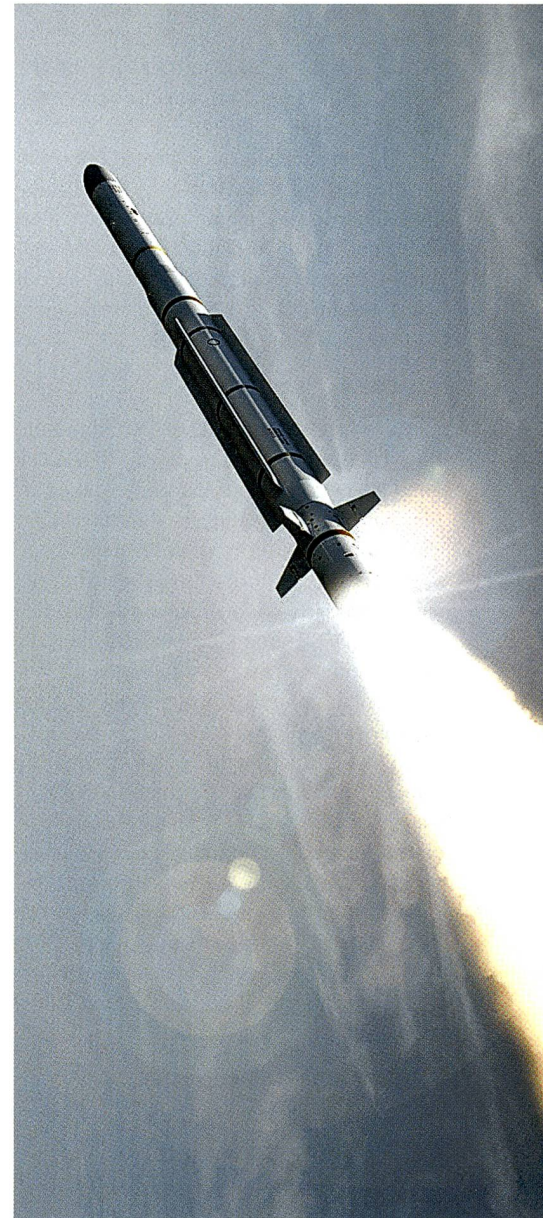
Die CAMM-ER des Unternehmens MBDA.

Kostenschätzungen in Rüstungsprojekten sind ein schwieriges Unterfangen. Die Beschaffung unterliegt dem Geschäftsgeheimnis. Genaue Angaben können erst mit dem Typenentscheid aufgrund der Of-