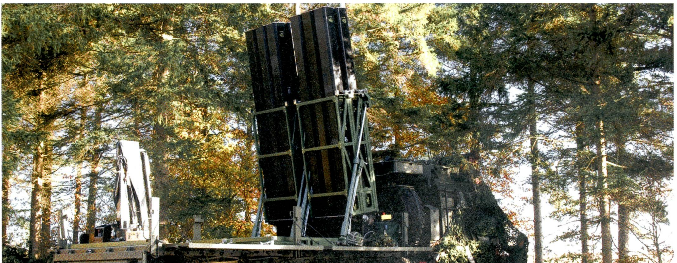
CAMM (Common Anti-Air Modular Missile) gehört zur Raketen-Familie, die MBDA zuerst für die britischen Streitkräfte entwickelte.