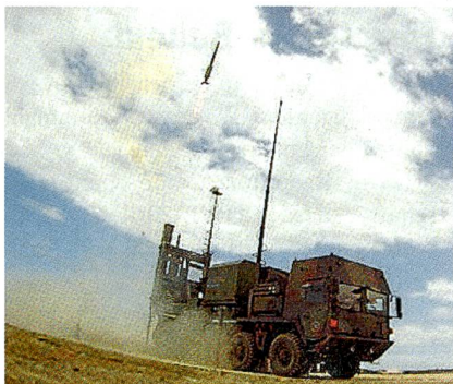
IRIS-T SL: Erfolgreicher Teststart.

Beim Projekt BODLUV 2020 handelt es sich um ein Abwehrsystem mit zwei unterschiedlichen Effektor-Reichweiten. Die mittlere Reichweite (MR) wirkt auf eine Distanz zwischen 20 und 50 km und die kurze Reichweite (KR, letzte Meile) auf eine Distanz von 3 km.