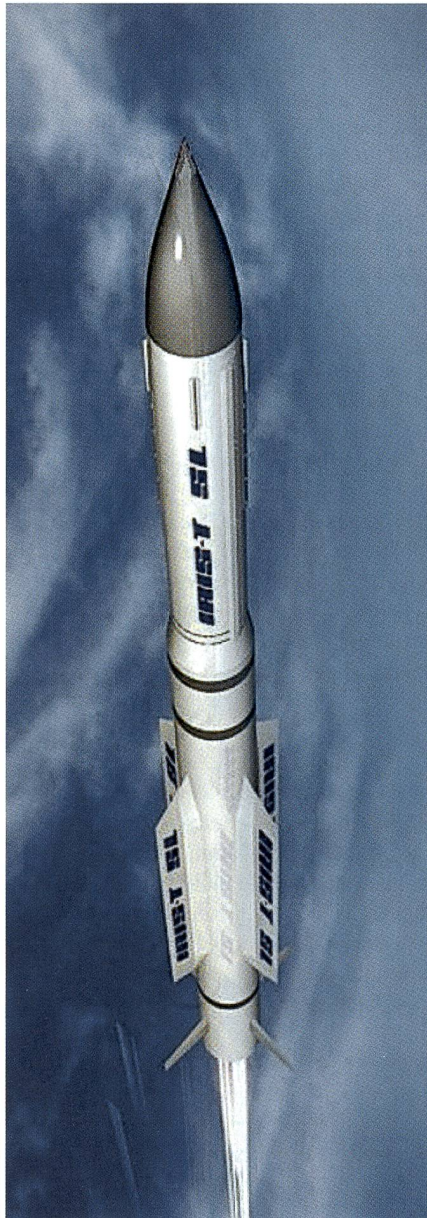
Die IRIS-T SL von Diehl, Überlingen.