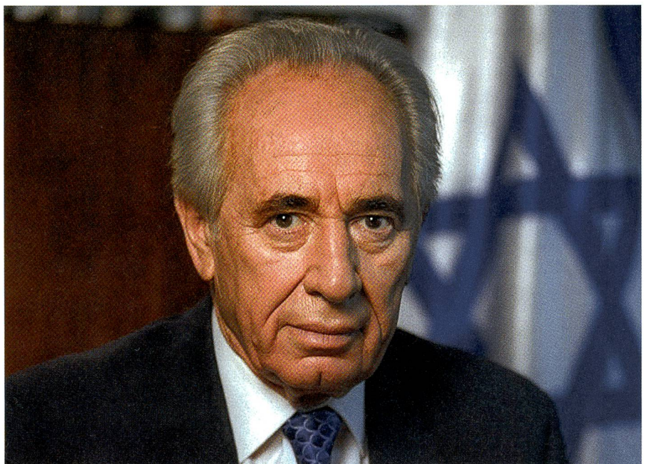
2007 wurde Shimon Peres Staatspräsident, ein Amt, das er mit Würde erfüllte.

Ben Gurion holte den Kibbuznik ins Verteidigungsministerium, wo er ihn mit der Rüstung betraute. Peres reiste nach Frankreich, wo ihm General de Gaulle die Grundlagen zum Bau der israelischen Atombombe verschaffte. Getarnt als Textilfabrik baute er in Dimona – in der Wüste Negev – den ersten Atomreaktor. Von 1968