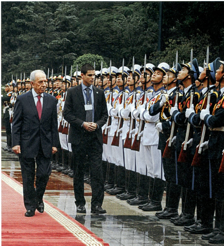
Der Staatspräsident Peres (hier mit Leibwächter) hatte Sinn für Repräsentation.

Die Spur eines Falken und einer Friedenstaube, die Spur eines sozialistischen Kibbuzniks, der Israel zur kapitalistischen Start-up-Nation machte, zur nach den USA erfolgreichsten Hightech-Macht der Welt; und die Spur eines Idealisten ohne Illusion, eines Realisten ohne Zynismus und eines glühenden zionistischen Patrioten, der kein Chauvinist war. fo. ■