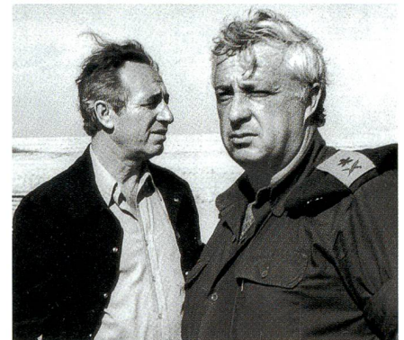
Peres mit General Sharon im Krieg.