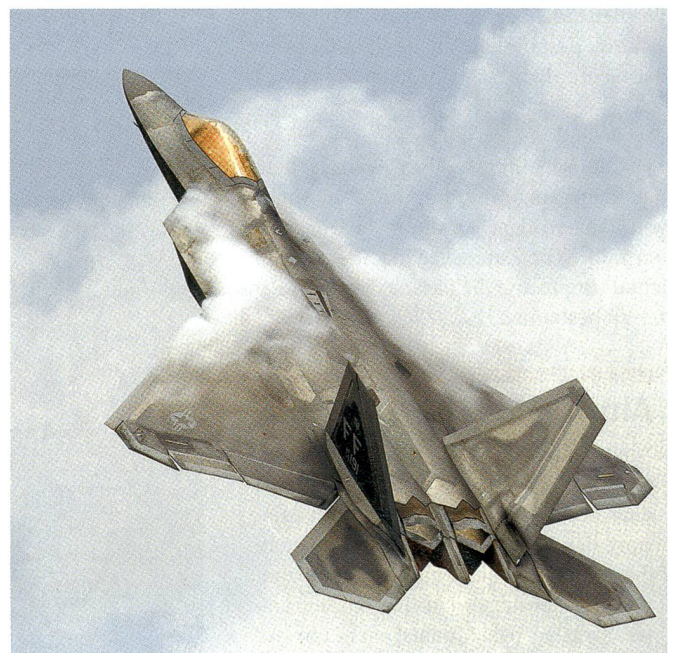
Ein amerikanischer F-22 Raptor steigt steil in den Himmel.