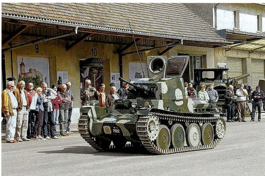
Die Schweizer Panzerwaffe im 2. Weltkrieg bestand aus 24 solcher Praga!

Am 6. Mai 2017 eröffnet das MiZ in der ehemaligen Stahlgiesserei im Mühllental eine neue Ausstellung zur Mechanisierung der Schweizer Armee. Diese steht den Besuchern nicht nur an den offiziellen Museumstagen (April–Oktober erster Samstag des Monats), sondern auf Anfrage auch für Führungen offen.