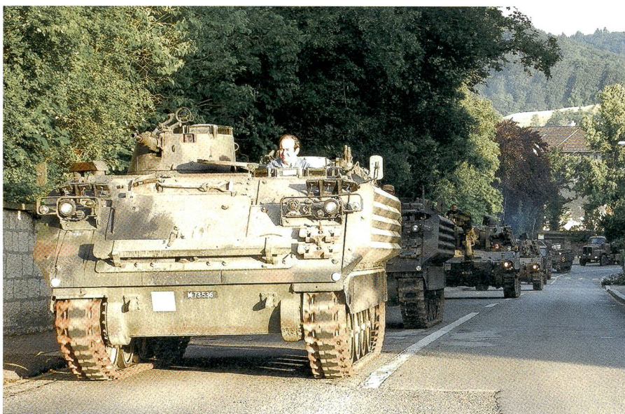
Korso von zwölf Panzern: Ein in der Schweiz mittlerweile ungewohntes Bild!