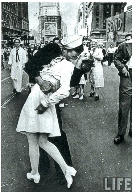
14. August 1945, Times Square, New York.

Es war Victory Day , der Siegestag in den USA. Europa hatte schon am 8./9. Mai 1945 gefeiert, nachdem Hitler-Deutschland