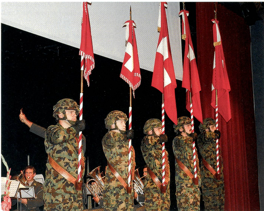
Die Suisse romande hat Sinn für Repräsentation: Die Feldzeichen der Ter Reg 1.

Luxemburg, erklärte die Sicherheitslage in und an den Grenzen von Europa.