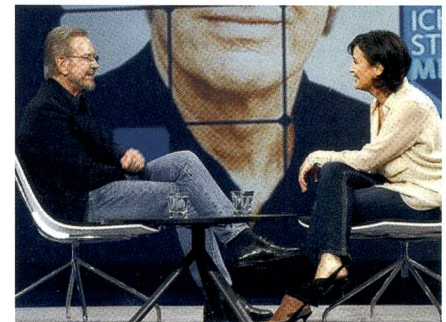
Jürgen Todenhöfer im Maischberger-Talk.

Mit dieser Sequenz beginnt der Film, der zehn Minuten, 35 Sekunden dauert. «Wir können uns nicht wehren und können jetzt auch nicht abhauen», warnt der Chauffeur seinen Passagier Todenhöfer, der auf der Weiterfahrt beharrt.