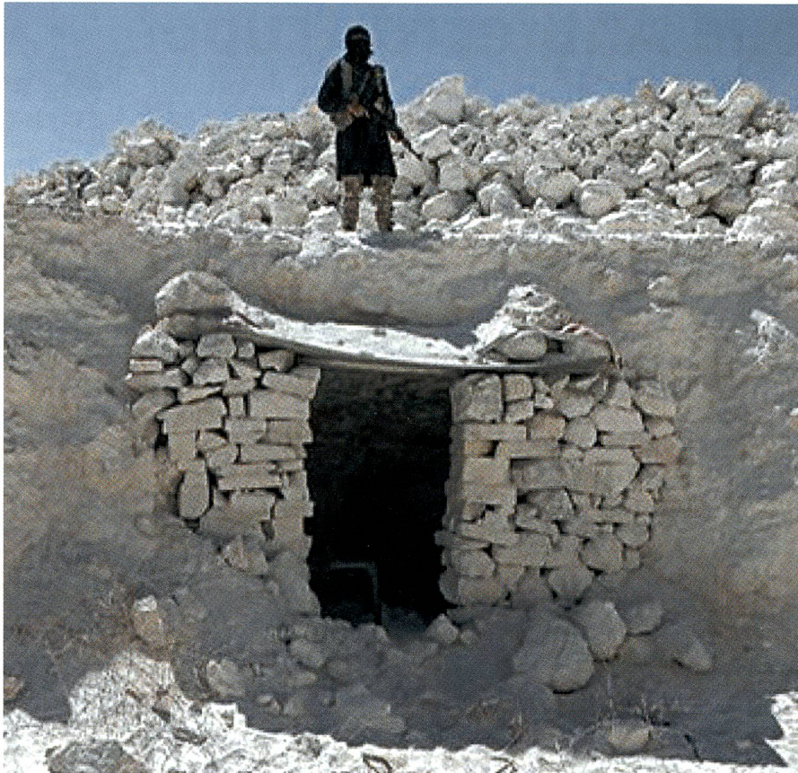
In dieser Höhle fand das Gespräch statt. Liegt sie auf Asad- oder al-Nusra-Gebiet?

Jürgen Todenhöfer übergab das an gewaltigen Sprüchen reiche Interview zuerst dem Russen-Sender Russia Today .