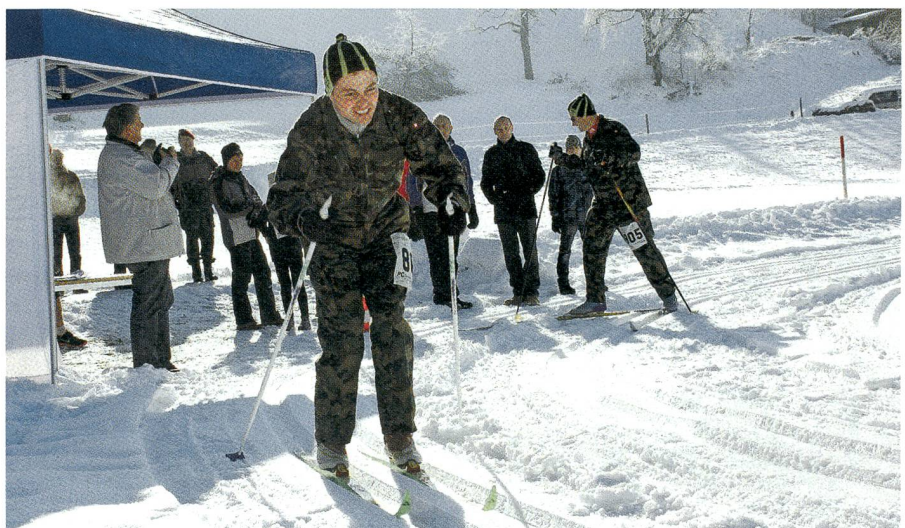
Aus vergangenen Zeiten: Der Bachtel-Winterwettkampf mit Langlauf als Disziplin.