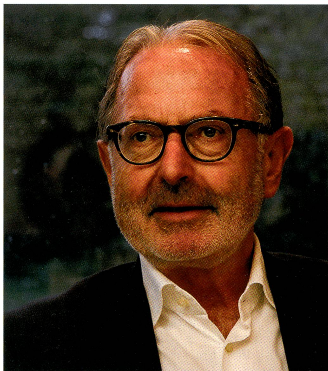
Der Unternehmer Hess wurde neu in den Nationalrat gewählt.