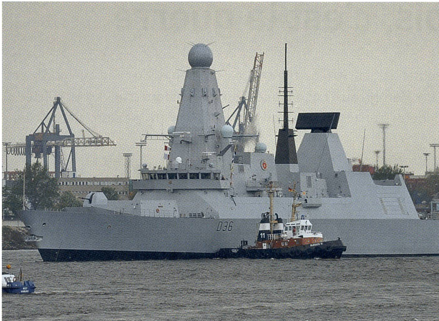
Der britische Zerstörer HMS Defender der Daring-Klasse ist von der Royal Navy zum Schutz des Flugzeugträgers Charles de Gaulle abgestellt worden.

51. Geschwaders «Immelmann» aus Jagel (Schleswig-Holstein) und ein Airbus-310-Tanker auch nach Incirlik (Türkei) verlegt. Zudem wird die am 11. November aus Wilhelmshaven ausgelaufene Fregatte Augsburg zum Schutze des französischen Flugzeugträgers Charles de Gaulle abgestellt.