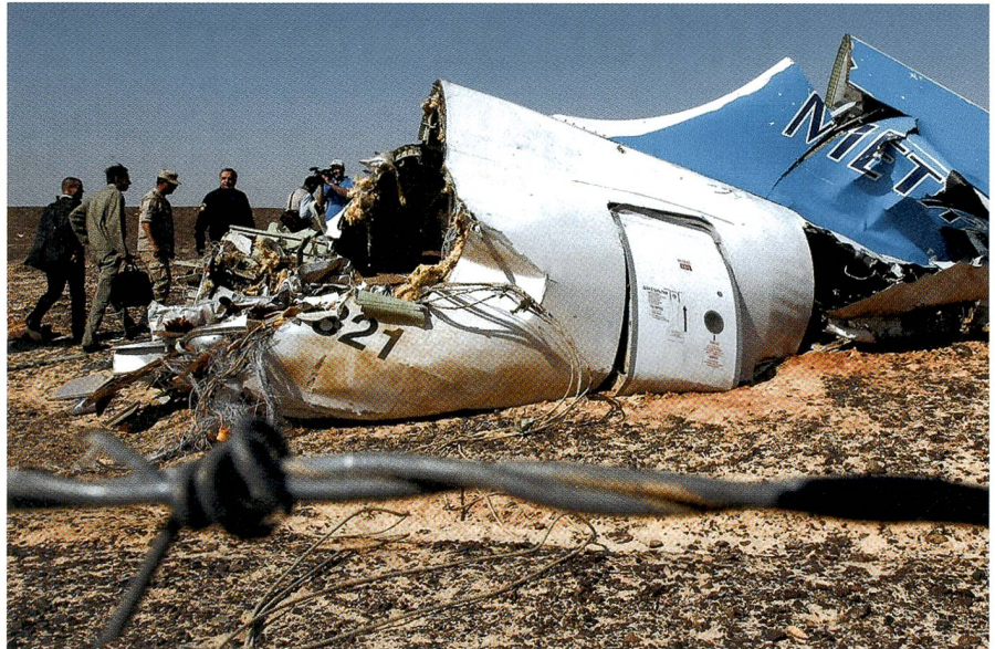
Zum Absturz des Metrojets erhärtet sich der Verdacht, dass der ISIS die Maschine in die Luft jagte. Offenbar schmuggelte ein Agent die Bombe in Sharm al-Sheikh an Bord.

Im Raum Kreuzlingen/Konstanz stehen das Tägermoos und selbst der Gottlieb Zoll nach wie vor Tag und Nacht sperrangelweit offen. Unsere grüne Grenze läßt Migranten geradezu ein; und nicht nur solche, auch Attentäter können kommen. Die bange Frage lautet: Muss denn zuerst etwas