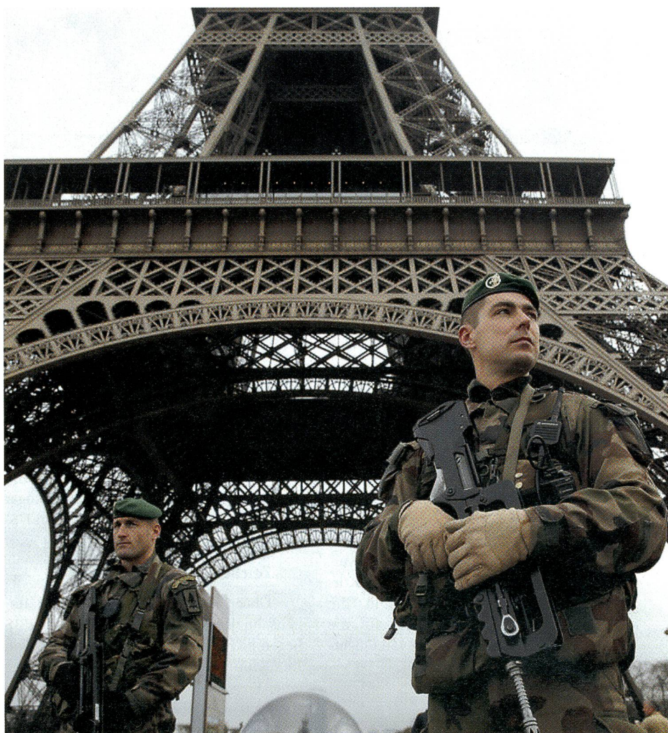
Französische Elitesoldaten patrouillieren am Eiffelturm, der geschlossen ist.

Eindringlich lehnen die Chefs der deutschen Behörden die Verantwortung ab, wenn die versagende Regierung Merkel die Grenzen aufhebt. Sie können die Sicherheit der Bundesrepublik nicht mehr gewährleis-