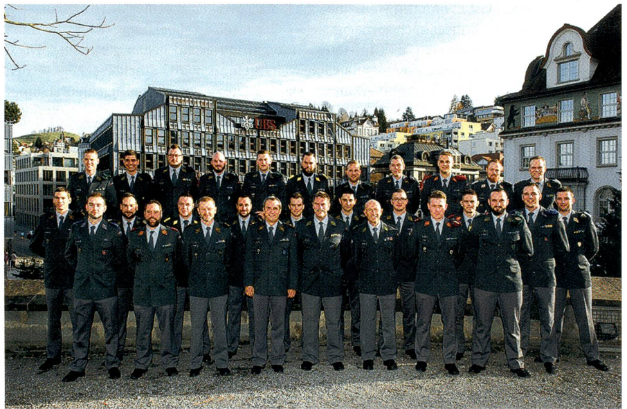
Herisau: Das obligate Gruppenbild mit den frisch brevetierten Berufsunteroffizieren.

Was für ein wahrlich prächtiges Bild, als die angehenden Berufsunteroffiziere in