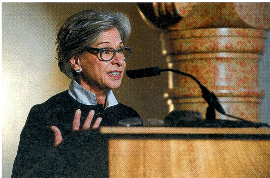
Wenn sie redet, hört man eine Stecknadel fallen: Regierungsrätin Widmer Gysel.