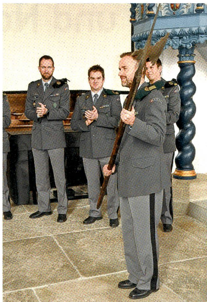
Abtretender Kommandant mit Hellebarde.