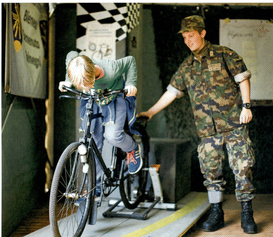
Ehrgeizige testen auf einem klassischen Militärvelo ihre Muskelkraft.

Gleichermassen auf Interesse stiess das Zelt, in welchem die Soldaten die Funktionsweise von militärischen Übermittlungsgeräten demonstrierten und praktisch zeigten, wie man damit ein ziviles Mobiltelefon anrufen kann. Andernorts konnte man sich das Innenleben einer Wettersonde erklären lassen. Die Sonde, verpackt in einer Styroporbox und an einem Ballon befestigt, liefert der Bodenmannschaft Wind-, Tempera-