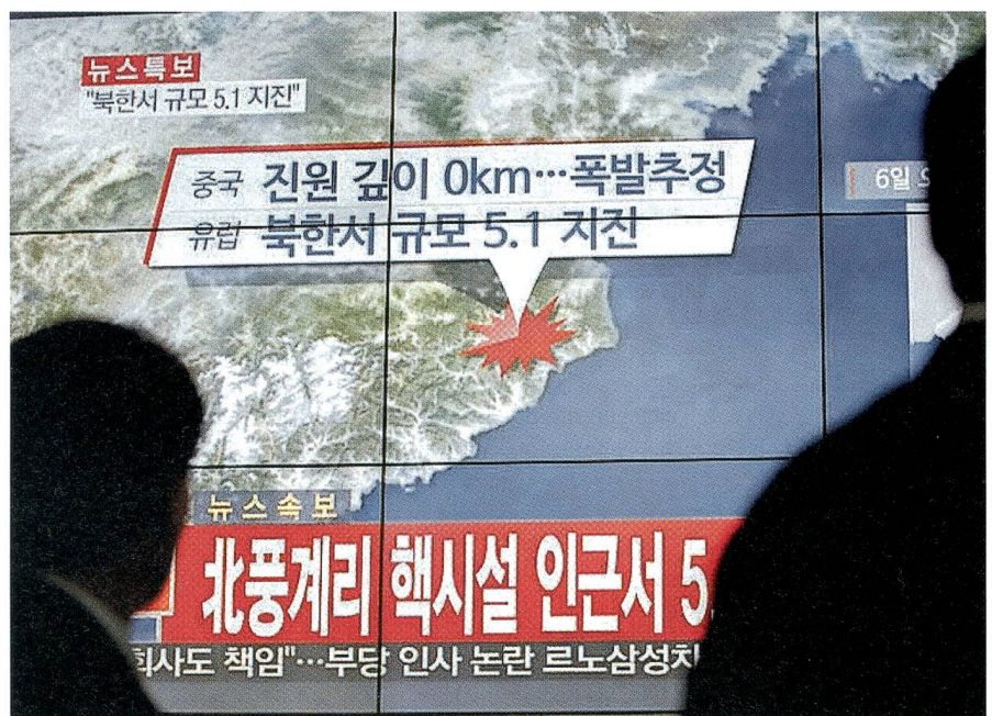
In Südkorea erfahren die Menschen, dass Nordkorea eine Nuklearwaffe zündete.