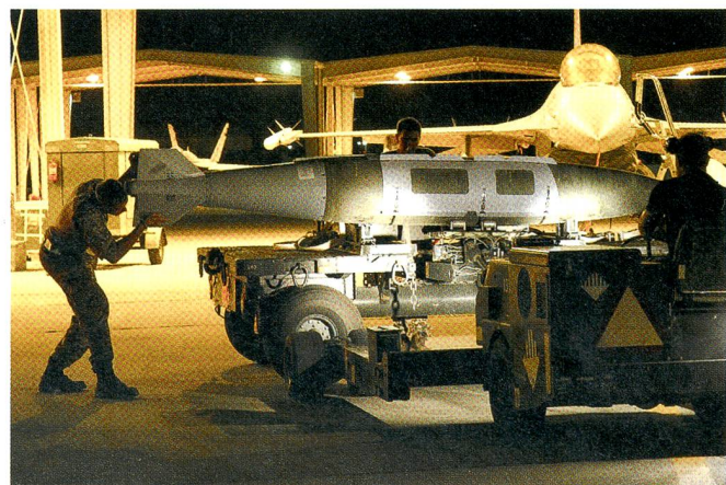
Zum letzten Mal montieren Dänen eine 2000-Pfund-Bombe an eine F-16. Im Oktober 2015 zog Dänemark die Luftwaffe zurück.