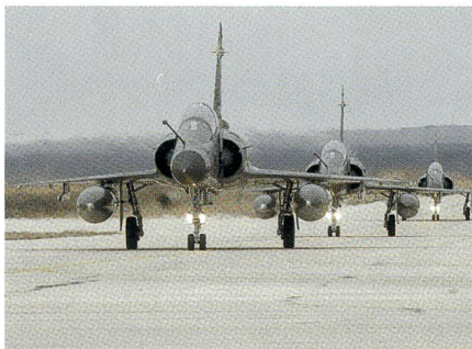
Drei Mirage 2000-N erreichen Jordanien.