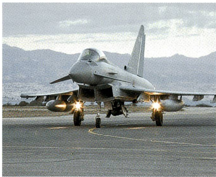
Zypern: Britischer Typhoon kehrt zurück.