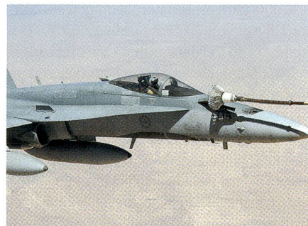
F/A-18, Kanada, von RAF Voyager betankt.

Bilder vom Syrienkrieg Der britische Blog airwars bringt jeden Tag präzise Einsatzrapporte zum alliierten Luftkrieg gegen den ISIS. Der Blog zitiert wörtlich die täglichen Bulletins der beteiligten Luftwaffen (ausser den russischen). Gleichzeitig wartet airwars mit gestochenen scharfen Bildern auf, welche die beteiligten Luftwaffen dem Blog zur Verfügung stellen. Hier eine Auswahl.