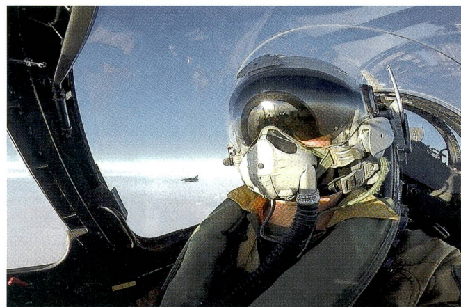
Französischer Kampfpilot über dem Fruchtbaren Halbmond.