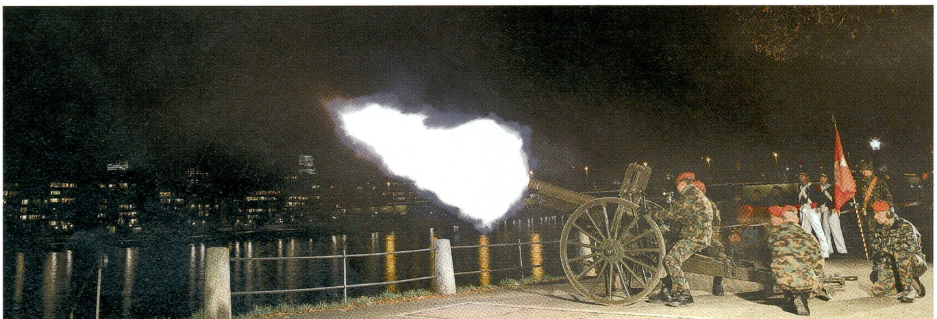
Barbara-Salut am Rheinufer in Basel.