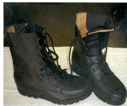
Militärschuhe sind nun mal aus Leder.