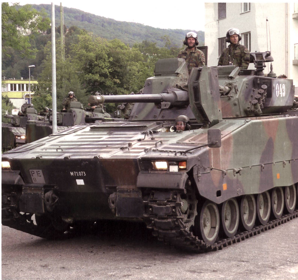
Auch beim Schützenpanzer CV-90 (hier im Manöver) gab es Gegengeschäfte.