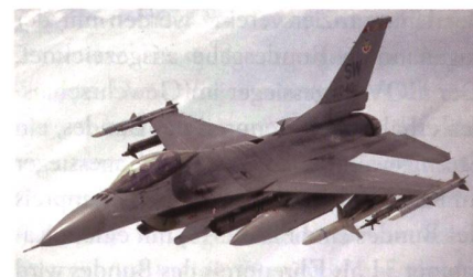
F-16 bleibt Arbeitspferd der Air Force.

Relevant ist die längere Lebensdauer für F-16C/D der Blocks 40 bis 52. Parallel dazu hat Lockheed Martin auch die voraussichtlichen Betriebskosten der Kampfflug-