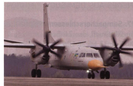
Erstflug der Antonov An-132D.

Die Avionik stammt von Honeywell und weitere wichtige Komponenten liefert Liebherr Aerospace bei. Das neue Transportflugzeug aus der Ukraine kann sowohl