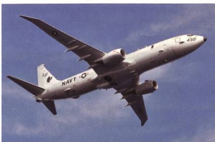
Seeaufklärungs- und U-Boot-Jagdflugzeug P-8A Poseidon.

Aus dem neuen Vertrag im Gesamtwert von 2,196 Milliarden Dollar soll die US Navy elf Flugzeuge erhalten (1,447 Mrd. Dollar), während vier weitere an Australien gehen (476,8 Mio. Dollar). Die Royal Air Force wiederum ist mit ihren er-