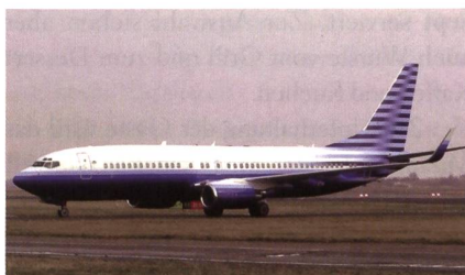
Boeing Business Jet 2 (BBJ 2) für Polen.

Die polnische Regierung hat drei neue 737-Modelle für den Transport von Offiziellen in Auftrag gegeben. Es geht bei der Bestellung um zwei BBJ 2 sowie eine normale 737-800. Die Lieferungen sollen Ende des Jahres beginnen und 2020 abgeschlossen sein. Laut dem stellvertretenden