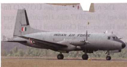
Transportflugzeug AVRO HS-748.

Laut dem Luftwaffenchef Birender Singh Dhanoa will Indien erneut einen Anlauf starten, um 56 mittelschwere Militärtransporter zu beschaffen. Dabei stehen die Karten für den C-295 gut. Die ersten 16 Maschinen könnten direkt ab dem Airbus Werk in Spanien geliefert werden, während die übrigen Maschinen dann in Indien