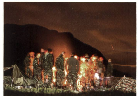
Biwak auf dem Pragel (1548 m.ü.M.).

In Einsätzen und für Unterstützungsleistungen hat die Schweizer Armee im vergangenen Jahr 236 368 Dienstage geleistet (Vorjahr: 207 140). Vor allem der subsidiäre Sicherungseinsatz zur Eröff-