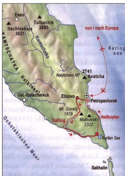
Geografie: Im Westen das Ochotskische Meer, die Halbinsel Kamtschatka und das geopolitisch wichtige Beringmeer.