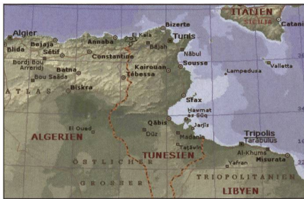
Maghreb: Algerien, Tunesien, Libyen.

Das Mandat der auf Ersuchen der libyschen Behörden im 2011 errichteten Unterstützungsmission in Libyen beinhaltet Sicherstellung des Übergangs zur De-