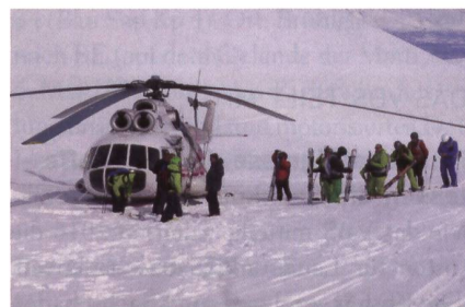
Der alte Mi-8-Heli nach der Landung.