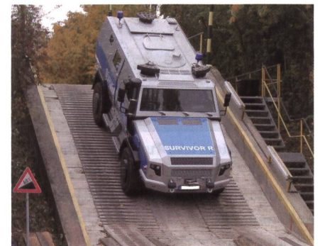
Rheinmetall Survivor R: Gefälle 60%.

Der Survivor R von Rheinmetall MAN Military Vehicles (RMMV) steht für die Themen Sicherheit und Mobilität. In Kooperation mit dem Spezialfahrzeugbauer Achleitner entwickelt, eignet sich der Survivor R sehr gut als geschützter