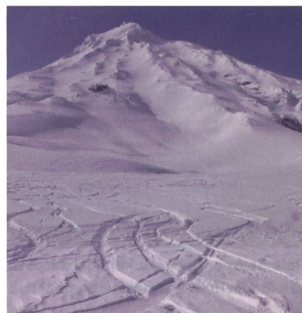
Tiefschnee in den Kamtschatka-Bergen. Die Berge der russischen Halbinsel eignen sich gut für den Heli-Skisport.