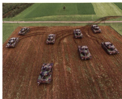
Tiefe Spuren. Dennoch kein Schaden: Das Stoppelfeld war speziell gemäht!

Wie das VBS mitteilt, wuchsen 2016 die Kosten für Land- und Sachschäden an: «Die Kosten von Land- und Sachschäden stieg auf 2,8 Millionen (2015: 1,9 Mio).