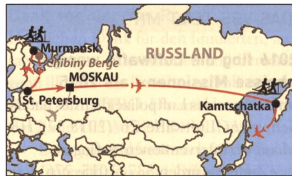
Flug Moskau-Kamtschatka, 8,5 Stunden.