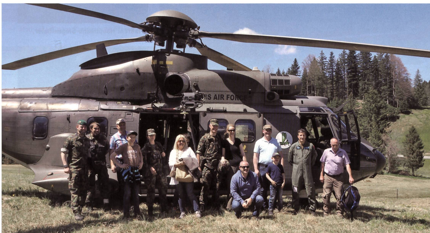
Besucherinnen und Besucher am Erlebnistag des Gebirgsschützenbataillons 6.

Zum Abschluss des erlebnisreichen Besuchstags wurden den Gästen eigens kreierte Schokolade sowie Biberli mit dem Emblem des Geb S Bat 6 überreicht. +