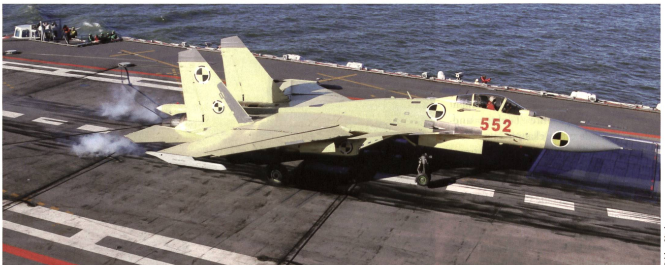
Auf dem Träger werden vor allem Kampfflugzeuge des Typs J-15 fliegen, wie hier bei der Landung auf der «Liaoning».

Dort werden gemäss der US Energy Information Administration bis zu 11 Milliarden Fass Erdöl (ein Fass entspricht etwa 160 Litern) und etwa 513 m 3 Erdgas vermutet. China schüttet seit gut vier Jahren - trotz eines Einspruches des Internationalen Seegerichts von Den Haag vom Juli 2016 und ungeachtet der verursachten Umweltzer-