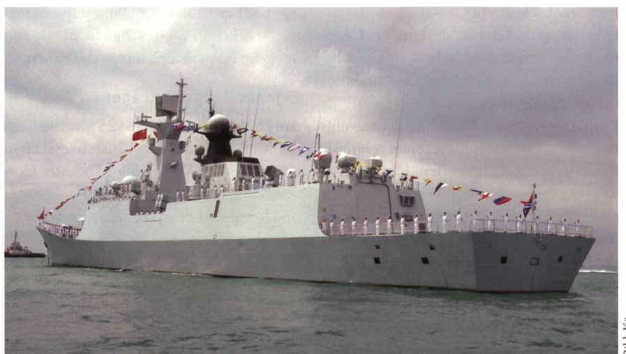
Zu den Begleitschiffen gehören Fregatten des Typs 054A, hier die Huangshan.

Noch ist die US Navy in zahlreichen Bereichen der Technologie führend, die jüngste Vergangenheit zeigt indes, dass China tüchtig zulegt und bei solchen Einschätzungen Vorsicht geboten ist. Immerhin bleibt offen, wie nachhaltig China die angestrebte globale Rolle mit einer eigenen Trägerflotte umsetzen kann. +