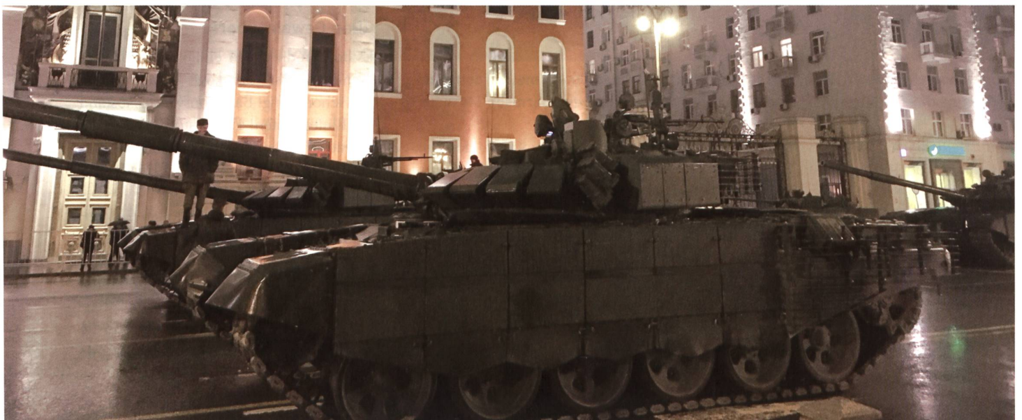
Zwei Kampfpanzer warten, bis sie mit ihrem Block, den Panzern der Garnison Moskau, zum Roten Platz abgerufen werden.

Die Einwohner von Moskau kennen das und machen seit dem Untergang der Sowjetunion ungeniert Fotos.