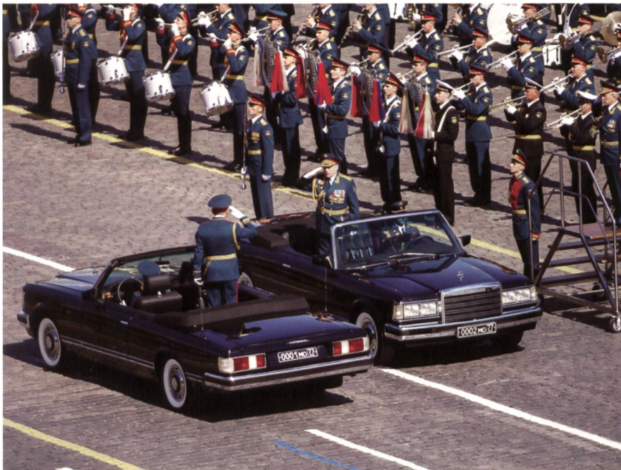
Generaloberst Salukow, Befehlshaber des Heeres (Wagen 0002), meldet dem Verteidigungsminister Shoigu (Wagen 0001) die Paradedruppe der Garnison Moskau.

Am 9. Mai 2017 rollten russische Arktis-Waffen über den Roten Platz. Mit Systemen, die Temperaturen von 40 Grad unter Null aushalten, hob der Generalstab die Bedeutung hervor, die er dem Wettlauf um den hohen Norden beimisst. Fast schon traditionell präsentierten die Panzer- und Artillerietruppen die Waffen, die an der Parade 2015 Aufsehen erregt hatten: den Kampfpanzer T-14, den Schützenpanzer Kurganets-25 und die 152-mm-Haubitze Koalizija. Raketenverbände beschlossen das Défilé: so Iskander, eingesetzt in Syrien, und RS-24-Yars.